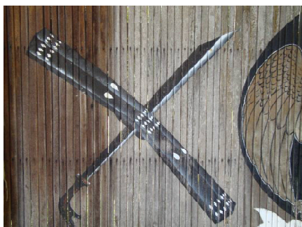
Gambar 2 Gambar Salawaku dan Samarang di pintu Kesultanan Ternate

berperang. Pada masa sekarang ketika penari memegang salawaku dia tidak boleh memosisikan salawaku dengan cara yang salah. Posisi salawaku selalu harus menghadap ke dalam, apabila menghadap ke luar berarti dia (penari) minta dibunuh. Kedua senjata tersebut meru-pakan satu kesatuan yang selalu dipasangkan dan tak boleh dipisahkan (Retnowati, dkk., 2011). Bahkan ketika kita mengambil gambar (foto) keduanya harus dalam posisi silang bukan terpisah atau sejajar. Gambar tersebut juga dapat dilihat pada pintu masuk area Kesultanan Ternate.