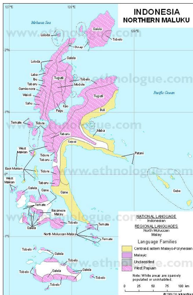
Gambar 1 Peta Bahasa-Bahasa di Maluku Utara (Lewis, 2009)

Saville-Troike (2003) hubungan antara bahasa dengan kebudayaan terletak dalam hubungan antara bentuk dan isi bahasa dan keyakinan, nilai dan kebutuhan-kebutuhan dalam rangka kebudayaan penuturnya. Kosakata memberi kita katalog hal yang dianggap penting untuk masyarakat, indeks cara penutur mengategorikan pengalaman, kontak masa lalu, keyakinan akan animasi dan kekuasaan relatif dari benda-benda dan kategori sosial yang menonjol dalam kebudayaan. Kramsch (dalam Risager 2008) berpendapat bahwa bahasa mengekspresikan fakta-fakta, ide-ide atau peristiwa-peristiwa yang dapat dikomunikasikan oleh mereka dengan merujuk pada tandon pengetahuan tentang dunia yang mereka ceritakan.